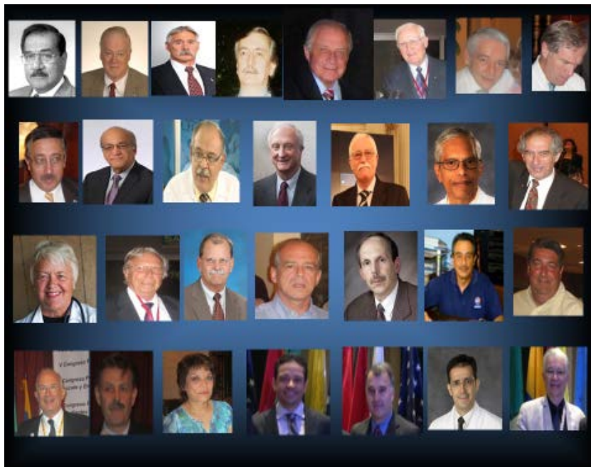
Foto 2: Presidentes da SPT 1987-2016

À medida que a Sociedade estava crescendo e saindo de sua infância, a diversidade multi-nacional e multicultural da organização se tornou um pilar proeminente de força e um traço universalmente admirado. Todos os países da América do Sul e suas organizações de trauma e de cirurgia começaram a participar e contribuir para a